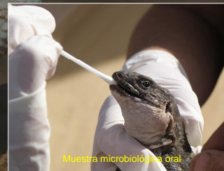
Muestra microbiológica oral