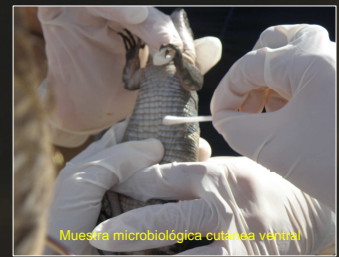
Muestra microbiológica cutánea ventral