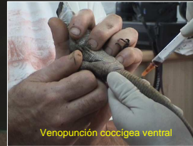
Venopunción coccígea ventral

Sólo se ha detectado un aislamiento del género Salmonella , lo que representa un 0.36 % del total de aislamientos. Se ha descrito también que los hongos siguen oscilaciones estacionales (se desarrollan más en primavera), y que la mayor insolación veraniega parece afectar a su desarrollo, dejando sus aislamientos en los valores más bajos.