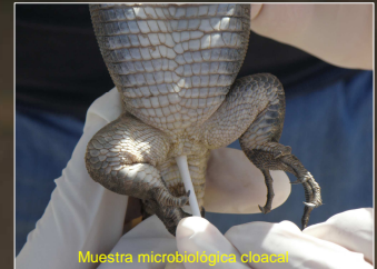
Muestra microbiológica cloacal