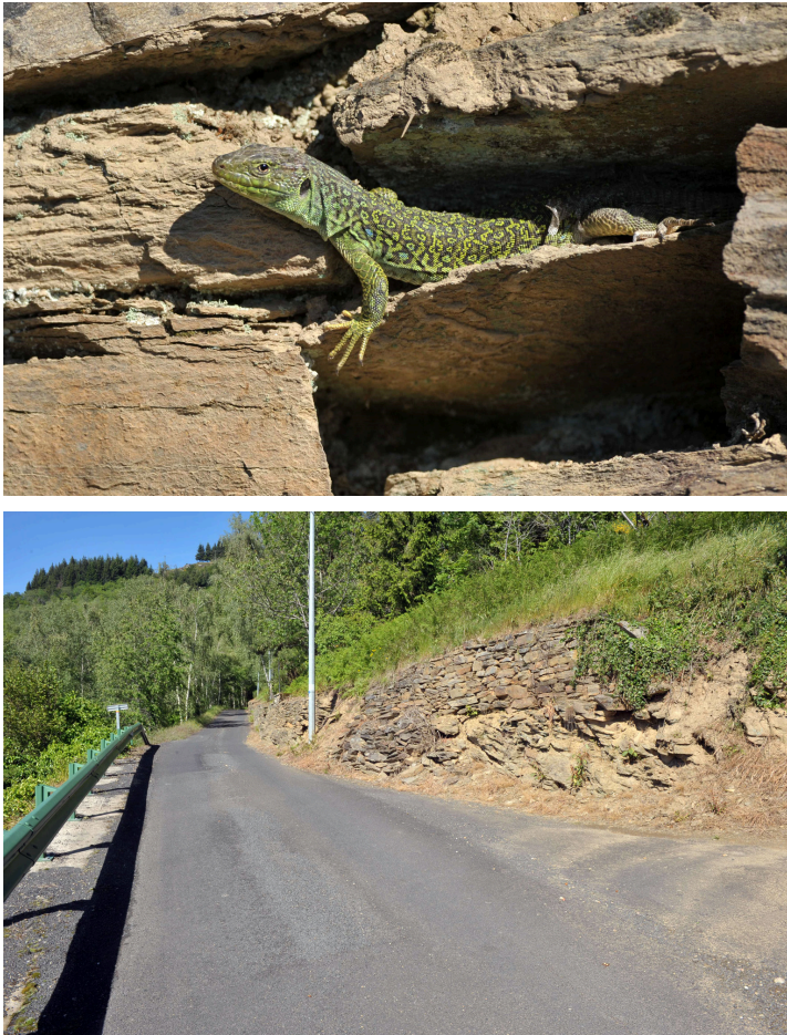
Figure 1 : (A) Timon lepidus . Femelle adulte n° 1 [en haut] et (B) son habitat (muret de pierres) [en bas] au hameau de La Roque, commune de Saint-Hippolyte, alt. 540 m, le 23 mai 2014. Notez le caractère forestier de l'environnement.

Le 03 juin 2014, en mission ornithologique, l'un de nous (S.T.) circule en automobile à hauteur du hameau d'Izaguette (alt. 325 m environ), lorsqu'il observe un grand lézard semblable à un Lézard ocellé se réfugiant dans une cavité proche de la route. Souhaitant l'identifier avec certitude, il fait demi-tour, stoppe son véhicule et opère un affût durant quelques minutes, à proche distance (5 m). Un mâle adulte de Lézard ocellé ne tarde pas à ressortir de la cavité. L'observateur n'a pas relevé de singularité concernant l'aspect externe de cet individu.