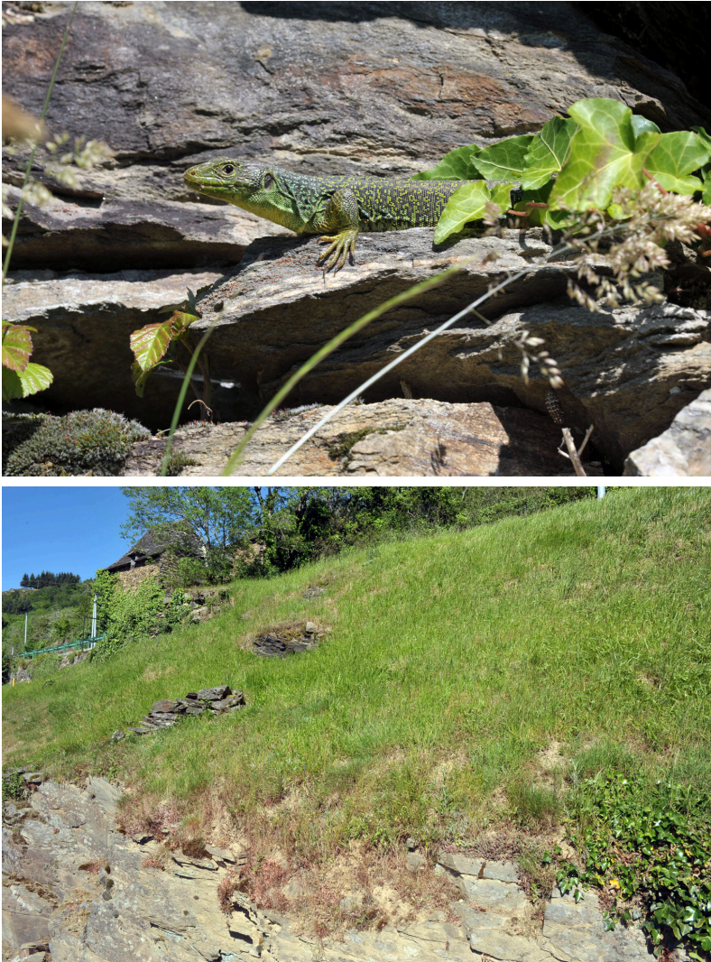
Figures 2 : (A) Timon lepidus . Femelle adulte n° 2 [en haut] et (B) son habitat (pelouse avec petits murets de pierres) [en bas]. Hameau de La Roque, commune de Saint-Hippolyte, alt. 535 m, le 23 mai 2014.

Situé non loin du hameau de La Roque (2 km environ au S-SO) à une altitude sensiblement moins élevée, le hameau d'Izaguette se trouve également en rive droite de la Truyère, mais au bord même de la rivière. Le contexte paysager est comparable à celui de La Roque, c'est à dire plutôt forestier et fermé, le hameau et ses environs immédiats présentant cependant une mosaïque de milieux ouverts anthropiques (jardins, prairies, lopins de vigne...).