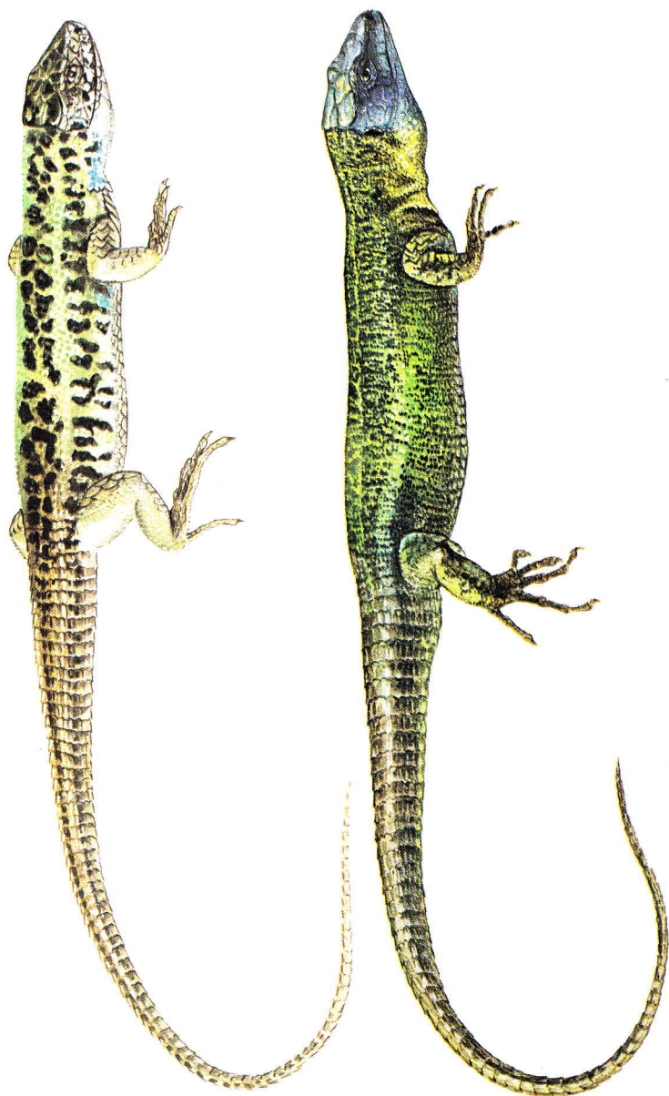
Lagarto verdinegro ( Lacerta schreiberi ); macho (abajo) y hembra (arriba)