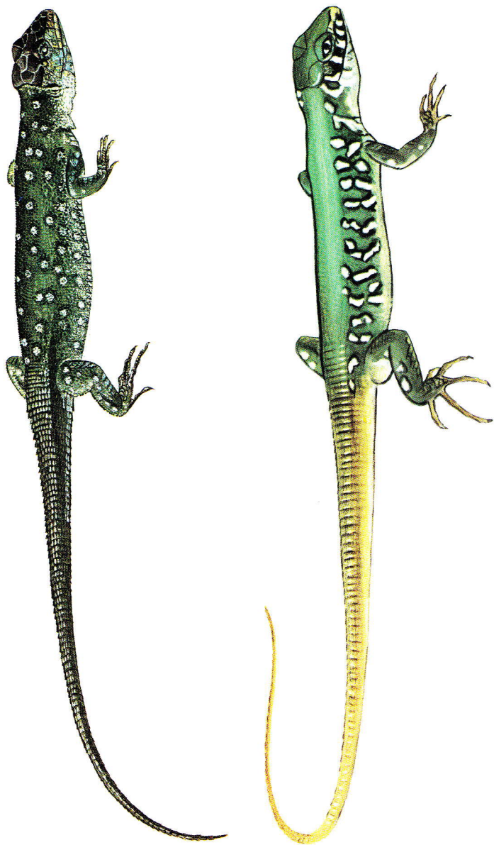
Arriba, Lagarto ocelado joven ( Lacerta lepida ); abajo, Lagarto verdinegro joven ( Lacerta schreiberi )