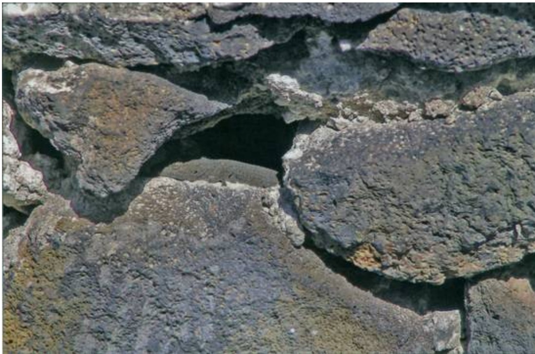
Abb. 7: Nur schwer zu entdecken: ein sich sonnender Kanarengecko; Fig. 7: Difficult to spot: a basking canary wall gecko

Eine vergleichende Beobachtung an Mauergeckos auf der zu Malta gehörenden Insel Gozo im Juli 2007 verlief vollkommen anders: dort konnte ich eine Tarnung der Geckos mit vollständigem Verharren am Ort nicht feststellen. In dem Ort Mgàrr fand ich um