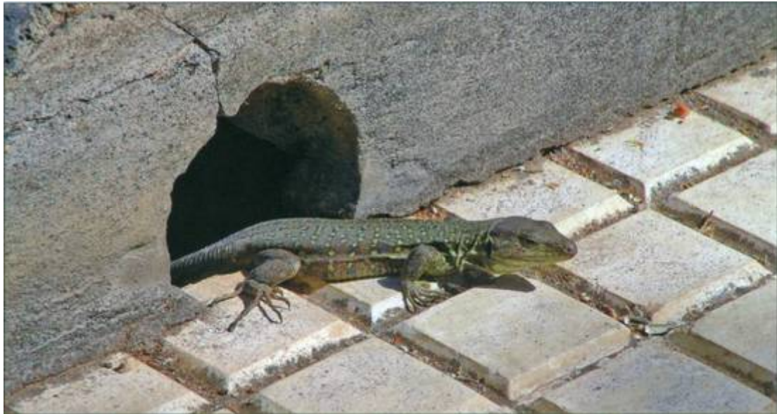
Abb. 5: Eine sich sonnende Kanareneidechse am Fuße der Mauer; Fig. 5: A basking Gallot's lizard at the base of the wall

Beim Betrachten dieser imposanten Eidechsen, besonders der adulten Männchen, entdeckte ich plötzlich an einem voll von der Sonne beschienenen Lavastein auch einen Kanarengecko. Dieser zeigte auf der nahezu schwarzen Lava eine ebensolche Färbung, so dass er nur schwer zu entdecken war. Zudem verharrte er regungslos flach an den Stein gepresst, obwohl ich mich ihm nun vorsichtig näherte. Die Pupillen des Tieres waren aufgrund des starken