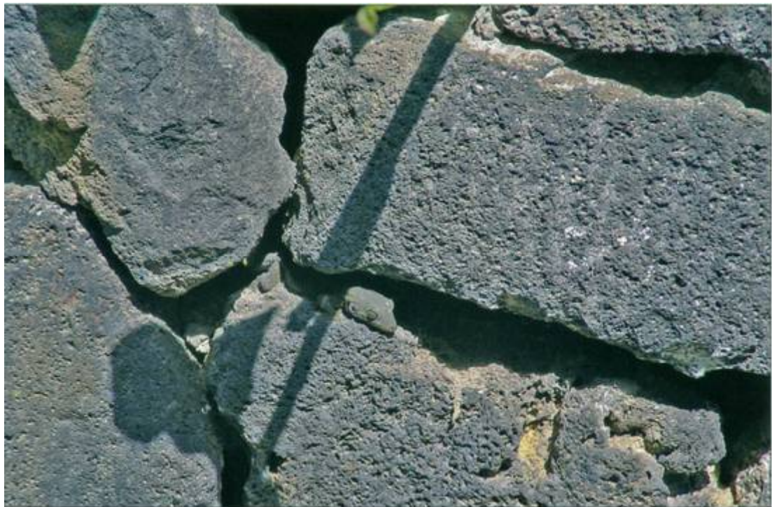
Abb. 8: Leicht zu übersehen: ein weiterer sich sonnender Kanarengecko Fig. 8: Easily overlooked: another basking canary wall gecko

11:15 Uhr fünf Mauergeckos ( Tarentola mauritanica [LINNAEUS, 1758]) beim Sonnenbaden. Sie befanden sich voll von der Sonne beschienen an einer Mauer aus dem typisch gelblichen Malteser Globigerinenkalk. Jedoch war ein schleichendes Annähern unmöglich und an ein Einfangen der Exemplare überhaupt nicht zu denken, denn ihre Fluchtdistanz betrug zwischen fünf und etwa zehn Metern. Alle fünf Mauergeckos verließen sich weder auf ihre dem Kalkstein angepasste gelbliche Tarnfärbung, noch waren sie offenbar von der direkten Sonneneinstrahlung geblendet. Ein weiteres Beobachten des Lernverhaltens von Kanareneidechsen erscheint angebracht, denn es ist zu vermuten, dass sie sowohl weitere Prädatoren als auch weitere „harmlose Lebewesen“ unterscheiden und auf deren Erscheinen unterschiedlich reagieren können. Ebenso stellt sich die Frage, wieso sich die Kanarengeckos wie beschrieben verhielten, was anscheinend gänzlich im Gegensatz zu ihrem sonstigen Verhalten während des Tages steht (siehe BÄEZ et al. 2000, BISCHOFF 1985a).