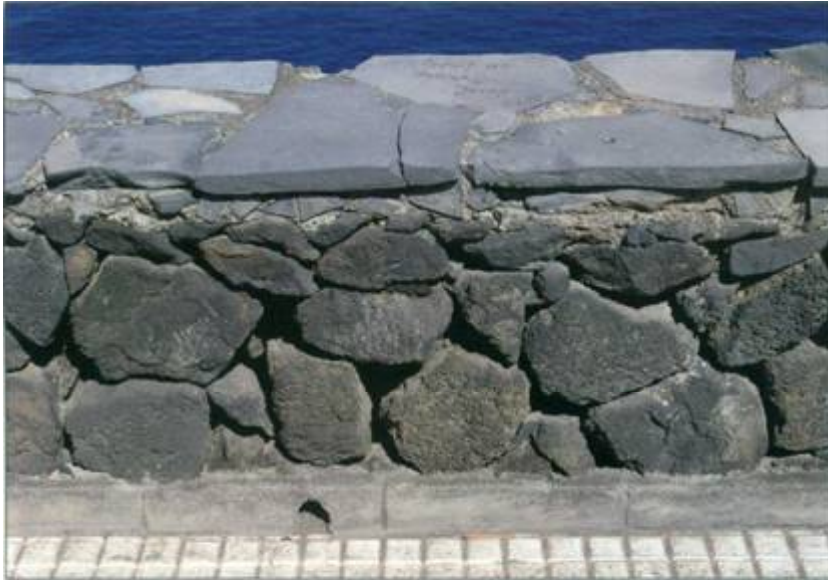
Oben Abb. 2: Teilstück der im Text beschriebenen Mauer mit einem sich sonnenden Kanarengecko