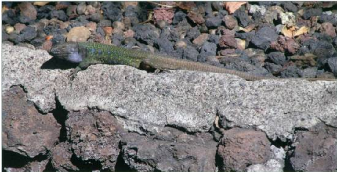
Abb. 4: Adultes Männchen von Gallotia galloti eisentrautii ; Fig. 4: An adult male of Gallotia galloti eisentrautii

Sonne vom wolkenfreien Himmel, und so „wimmelte“ es an einer einen Gehweg begrenzenden Mauer in Hotelnähe nur so von Kanareneidechsen unterschiedlicher Alterstufen und beiderlei Geschlechts. Bedingt durch die ständige Präsenz von zahlreichen flanierenden Touristen zeigten die Kanareneidechsen hier generell nur eine sehr geringe Fluchtdistanz. Einige Exemplare flüchteten erst beim Unterschreiten von etwa 40 cm Abstand.