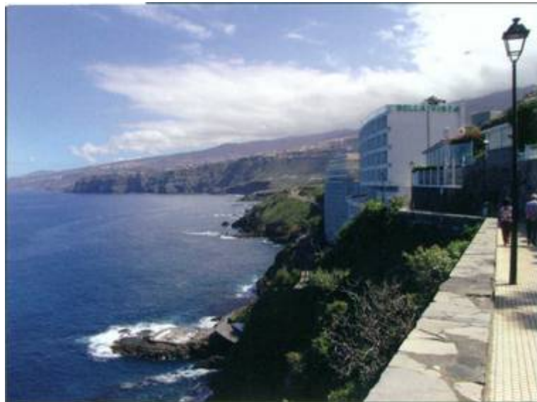
Fig. 1: Site of the observation at Puerto de la Cruz in central northern Tenerife with the loose lava rock demarcation wall on the left

Abb. 1: Beobachtungsort in Puerto de la Cruz im zentralen Norden Teneriffas; links die im Text beschriebene Mauer aus Lava