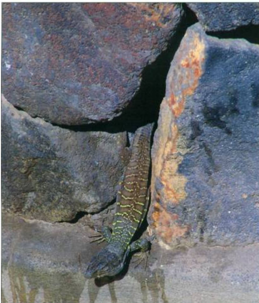
Bottom fig. 3: A basking Gallot's lizard at the base of the wall

Trotzdem wollte ich möglichst viele Mitglieder der heimischen Herpetofauna sehen, und so suchte ich mehrmals am Abend und nachts in der Umgebung des Hotels Semiramis nach Kanarengeckos, Tarentola delalandii (DUMERIL & BIBRON, 1836), leider jedoch erfolglos. Während dieser bewölkten Zeit fand ich nur während des Tages einige Geckos versteckt unter Steinen liegend auf am Ortsrand befindlichen Feldern. Sowie die Sonne auch nur schwach durch die Wolken drang, kamen die prächtig gefärbten Kanareneidechsen, Gallotia galloti eisentrautii ISCHOFF, 1982, in großer Zahl aus ihren Verstecken, um sich zu sonnen. Beliebte Verstecke der Eidechsen waren aus Lava bestehende Legesteinmauern, da diese zahllose Löcher, Spalten und Gänge aufweisen. Am 19. Februar gegen 12:30 Uhr schien die