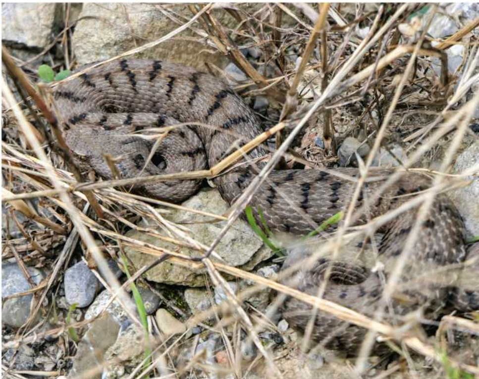
Abb. 6: Adulte Aspispiper in den Weinbergen des Lavaux.

Schwerpunkte der Verbreitung von V. aspis sind Frankreich (bis fast an die Luxemburger Grenze), die Schweiz und Italien. Selbst im äussersten Südwesten Deutschlands (Südschwarzwald) ist diese Art vertreten, wenn auch sehr selten und vom Aussterben bedroht (GLANDT 2018). In der Schweiz ist sie dagegen relativ weit verbreitet, konzentriert sich dabei auf den Jura im Westen, auf den südlichen Kanton Bern, das Wallis und auf das Tessin (HOFER ET AL. 2001). Im Schweizer Mittelland fehlt die Art weitgehend, vom südlichsten Part am Genfer See abgesehen.