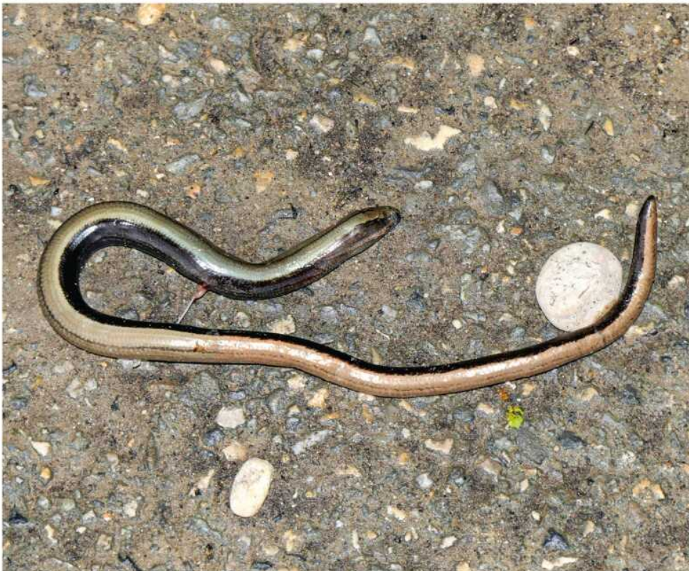
Abb. 11: Die Westliche Blindschleiche, ein häufiges und weitverbreitetes Reptil in der Schweiz und ganz Mitteleuropa, konnten wir nur einmal als totes Jungtier bei Yverdon-les-Bains bestätigen.

Die Zauneidechse ist in der Nord- und Westschweiz weit verbreitet und besiedelt auch die Täler von Inn (En), Vorderrhein und Rhone. Sogar im Tessin gibt es neuerdings einen Fund (von 2021: SZKF/CSCF 2022). Hinsichtlich ihrer Grösse steht sie zwischen der schlanken, flach gebauten Mauereidechse und der kräftigeren Smaragdeidechse. Sie ist im südlichen Mitteleuropa, also auch in der Schweiz, ein Ubiquist, wie HOFER ET AL. (2001) betonen. So besiedle kein anderes heimisches Reptil ein vergleichbar breites Lebensraumspektrum von Mooren über Feuchtwiesen und Auwälder bis hin zu Schutthalden, wenngleich immerhin eine Präferenz für südexponierte Saumbiotope feststellbar sei. Bedeutend für L. agilis sind überdies Sekundärbiotope wie naturnahe Gärten, Bahnanlagen und aufgegebene Industrieflächen (BLANKE 1999, HOFER ET AL. 2001). Überall wichtig sind grabfähige Böden zur Eiablage (GLANDT 2018). Die Rote Liste führt die Zauneidechse als «verletzlich» und vermerkt überdies einen «gene-