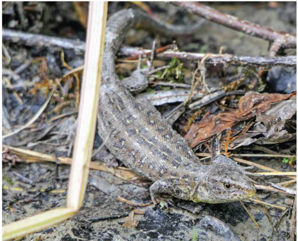
Abb. 12: Weibchen der Zauneidechse am Ufer des Pérolles-Sees, eines Stausees der Saane (Sarine) bei Fribourg.