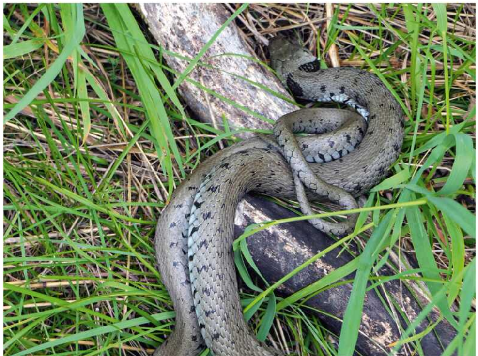
Abb. 7: Grosses, gut 100 cm langes Weibchen der Barren-Ringelnatter auf einer Wiese im oberen Bereich des Tals der Saane (Sarine) bei Pierraforttscha/Fribourg.

Den Verfassern des vorliegenden Textes glückten zwei Sichtungen von Schweizer Barrenringelnattern: Am 26.7. auf dem Gebiet der Gemeinde Pierraforttscha vor den Toren Fribourgs, das grosse, etwa 110 cm lange Weibchen lag vor einem Heckenstrei-