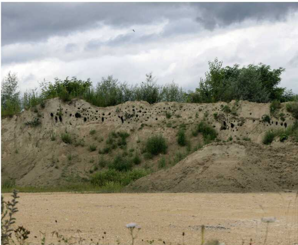
Abb. 13: Brutkolonie (Brutröhren) der Uferschwalbe an einer Aufschüttung bei Grandson.

In den Weinbergen des Lavaux bei Grandvaux beeindruckte uns nachmittags ein Rotfuchs, der es fertigbrachte, bei unserem Anblick mit einigem Gepolter über eine mannshohe Mauer am Wegrand zu setzen. Vollkommen überrascht waren wir ausserdem über zwei Gämsen, Geiss und Kitz, im «Stadtwald» von Fribourg oberhalb der Beatuskapelle am Galterntal. Erwähnenswert ist zudem der nächtliche Fund einer männlichen Kräuseljagdspinne ( Zoropsis spinimana , Abb. 14) auf einer Hauswand unweit des Fribourger Kathedrale und die Beobachtung der Springspinne Icius subinermis (Weibchen) auf einem Obstbaum bei Grandson.