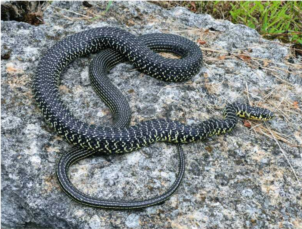
Abb. 8: Gelbgrüne Zornnatter auf einer Weinbergsmauer bei Onnens/Bonnevillars (am Neuenburger See); die eindrucksvolle Schlange war etwa 130 cm lang.