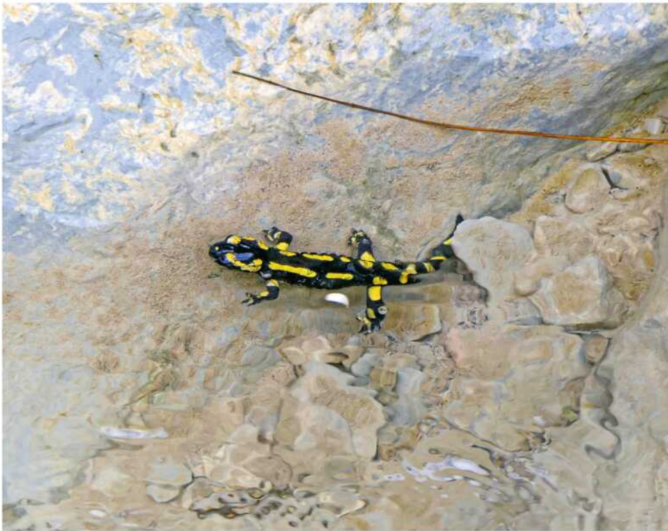
Abb. 3: Feuersalamander in einem Kolk des Champafion oberhalb von Riex (Lavaux).