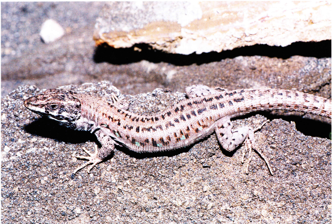
Ejemplar de la subespecie Gallotia atlantica atlantica procedente de Caleta Famara (Lanzarote).

Conservación.- Con la salvedad de la población localizada en el roque del Este, donde sus densidades son muy bajas, y en las lavas recientes de Timanfaya, que no han llegado a colonizar, Gallotia atlantica es una lagartija abundante en todo su área de distribución, con densidades que pueden superar los 2300 ejemplares por hectárea. La UICN la considera por eso una especie de Preocupación Menor (LC) .