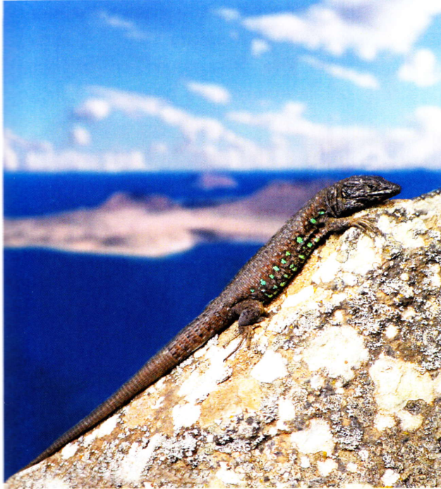
Macho adulto de Gallotia atlantica cerca de Guinate (Lanzarote); al fondo, la Graciosa y Montaña Clara, dos de las islas que componen el archipiélago Chinijo.

39 y 54 en la zona media del cuerpo), o por sus escamas ventrales dispuestas en 8 o 10 series longitudinales. Las lagartijas atlánticas presentan dientes romos en dentario y maxilar.