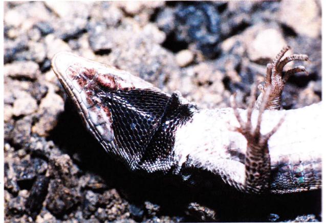
El lagarto atlántico, independientemente de su procedencia, siempre presenta la garganta negra o muy oscura. En la fotografía de Ph. Geniez, un ejemplar de Teguisse (Lanzarote).

contrastan con la coloración de fondo. En los flancos se disponen manchas azules o verdes que, en el caso de los machos de la subespecie G. atlantica laurae se hacen muy grandes y brillantes (generalmente también pierden las bandas claras). La garganta suele ser negra en las lagartijas de Lanzarote, y gris más o menos oscuro en los de Fuerteventura.