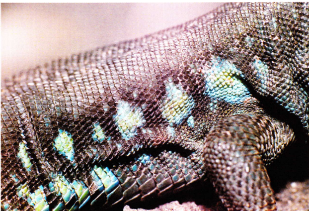
Flanco con grandes manchas azules de un ejemplar perteneciente de la subespecie Gallotia atlantica laurae , procedente de los alrededores de la Cueva de los Verdes.

Otras diferencias morfológicas asociadas a determinadas áreas geográficas que no han llegado a ser descritas como subespecies, como el reducido número de escamas supratemporales que presentan los ejemplares del roque del Este, pueden explicarse también por efecto de fundador y/o deriva genética, mientras que el pequeño tamaño corporal de los de Montaña Clara ha sido achacado a la abundancia de musarañas ( Crocidura canariensis ) en ese islote y a la presión de depredación que ejercen sobre las lagartijas.