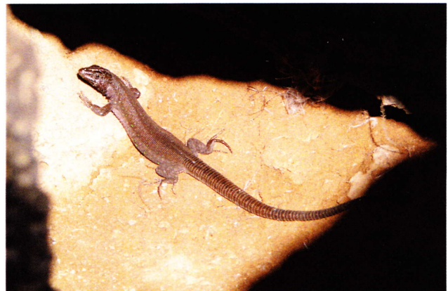
Ejemplar de Gallotia atlantica ibagnezi , una subespecie descrita para el islote de Alegranza.

Otra población descrita como subespecie es la de Alegranza ( Gallotia atlantica ibagnezi Castroviejo, Collado y Mateo, 1989), que está caracterizada por un bajísimo número de poros femorales y de escamas gulares, probablemente determinado por un efecto de fundador.