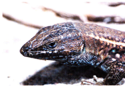
Gallotia atlantica mahoratae , Betancuria (Fuerteventura).

Categoría de Amenaza (UICN): Preocupación Menor (LC)