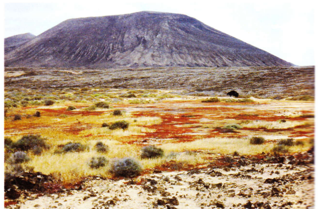
Isla de La Graciosa.

Biología.- Gallotia atlantica es un saurio de hábitos diurnos que regula su temperatura interna por exposición directa a los rayos del sol. A baja altitud puede permanecer activo la mayor parte del año; únicamente en las zonas más elevadas de Fuerteventura (pico de la Zarza y alrededores) puede permanecer algún tiempo en brumación.