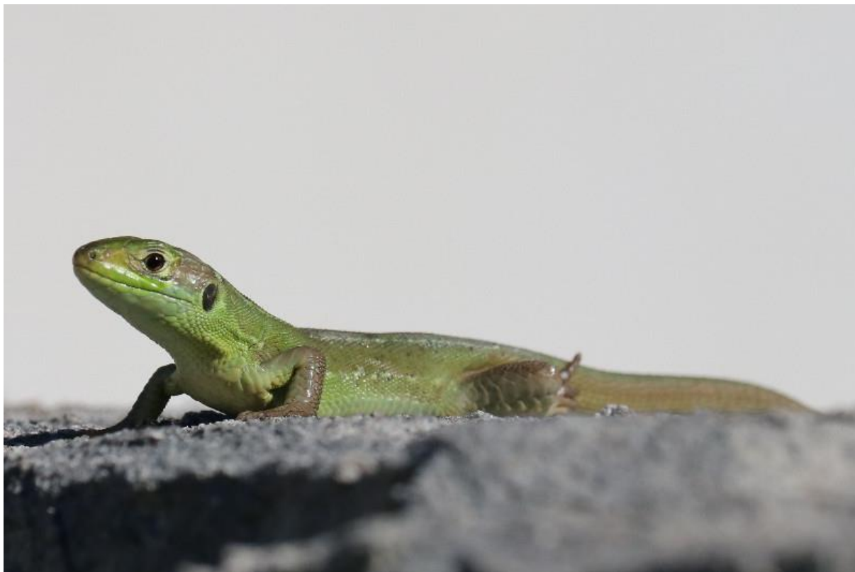
Figure 50 : Lézard à deux raies

Lézard à deux raies ou vert occidental – Lacerta bilineata Daudin, 1802