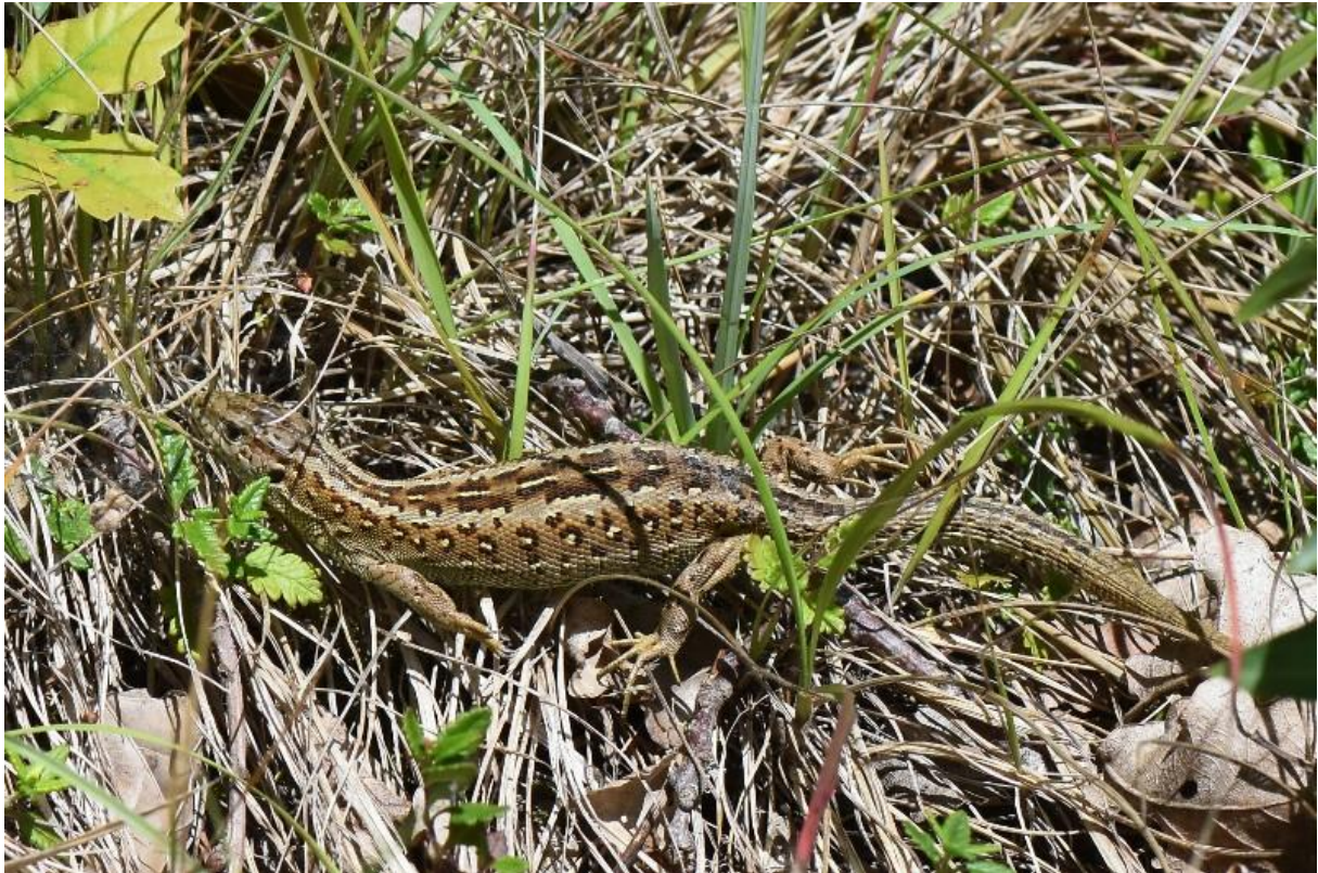
Figure 48 : Lézard des souches