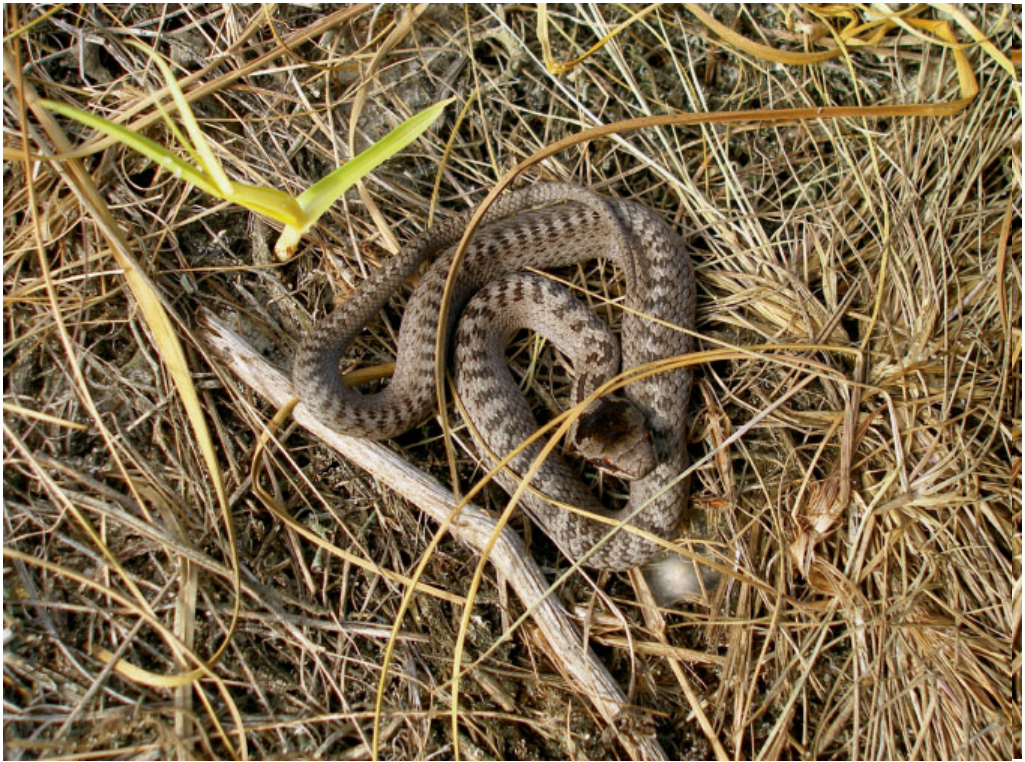
Abb. 3: Jungtier der Glattnatter, NSG Ribnitzer Großes Moor (23. Sept. 2009)

verschlechternder Lebensbedingungen (Wiederaufforstung anthropogener Offenlandschaften auf ehemaligen Militärf Flächen) für das zweite Vorkommen der Erhaltungszustand als „mittelschlecht“ bewertet wurde.