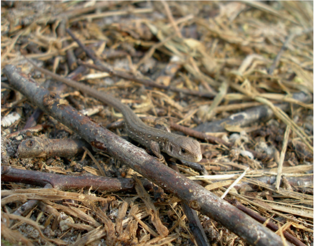
Abb. 2: Schlüpfling der Zauneidechse, NSG Ribnitzer Großes Moor

Suche nur einen Nachweis erbrachte und daher ein „äußerst seltenes“ Auftreten der Zauneidechse vermutete – ein Hinweis auf seitdem erfolgte Habitatveränderungen? Für die Vorkommen in der Kiesgrube bei Wusseken sowie bei Klein Görnow liegen keine Vergleichsdaten vor; diese Vorkommen sind jedoch den jeweiligen Bearbeitern seit ca. 1970 (Wusseken) bzw. 1999...2001 (Klein Görnow) bekannt.