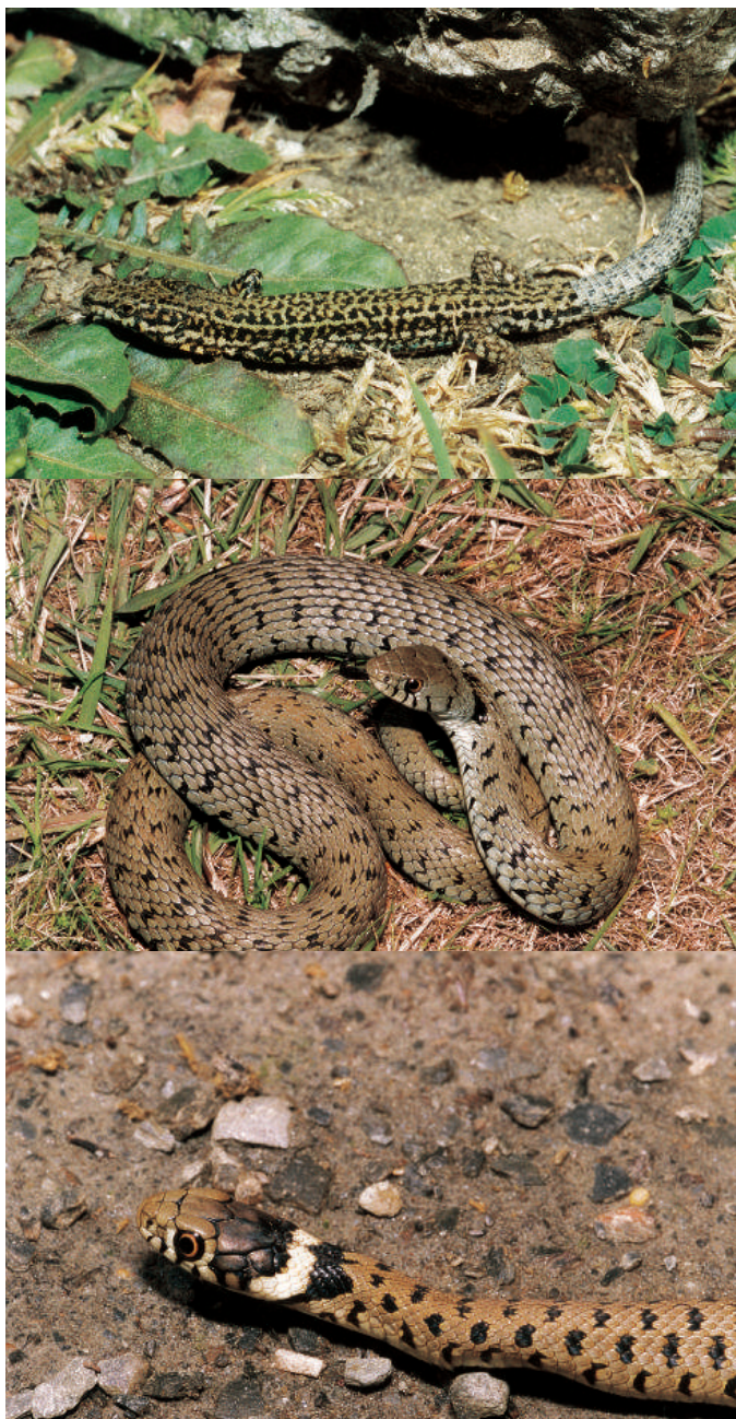
Figure 5 : Podarcis hispanica sebastiani ♂