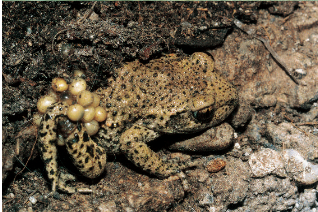
Figure 1 : Alytes obstetricans almogavarii ♂ Figure 2 : Alytes obstetricans almogavarii subadulte Figure 3 : Alytes obstetricans obstetricans ~ almogavarii ♂