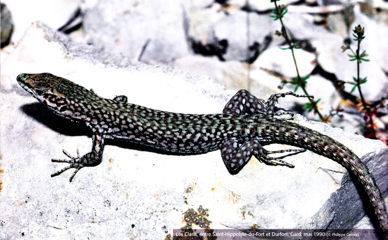
Les Claris, entre Saint-Hippolyte-du-Fort et Durfort, Gard, mai 1990