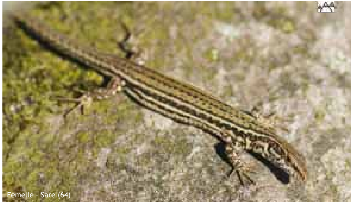
Femelle - Sare (64)

Anciennement Lézard hispanique Podarcis hispanica