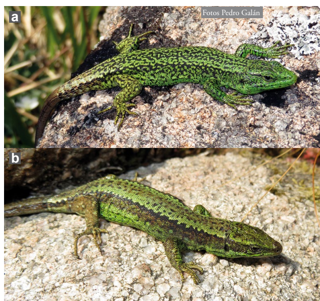
Figura 1: Iberolacerta monticola del Monte Pindo. a) Macho y b) hembra. Esta población presenta ciertas diferencias morfológicas con respecto a otras de su especie; entre ellas, la pigmentación verde es muy intensa en los machos adultos y también se observa en algunas hembras, como la de la fotografía.

con respecto a otras poblaciones de las zonas de baja altitud de Galicia en lo referente a la mayor altura proporcional de la cabeza de los machos, una superior frecuencia de aparición de una placa supernumeraria entre las placas supranasales y el número medio de escamas dorsales y ventrales (Galán et al. , 2007b), además de la pigmentación verde muy extensa en los adultos (Figura 1), más que en otras poblaciones de Galicia (Galán, 2008 y Galán, inédito). Se han encontrado haplotipos