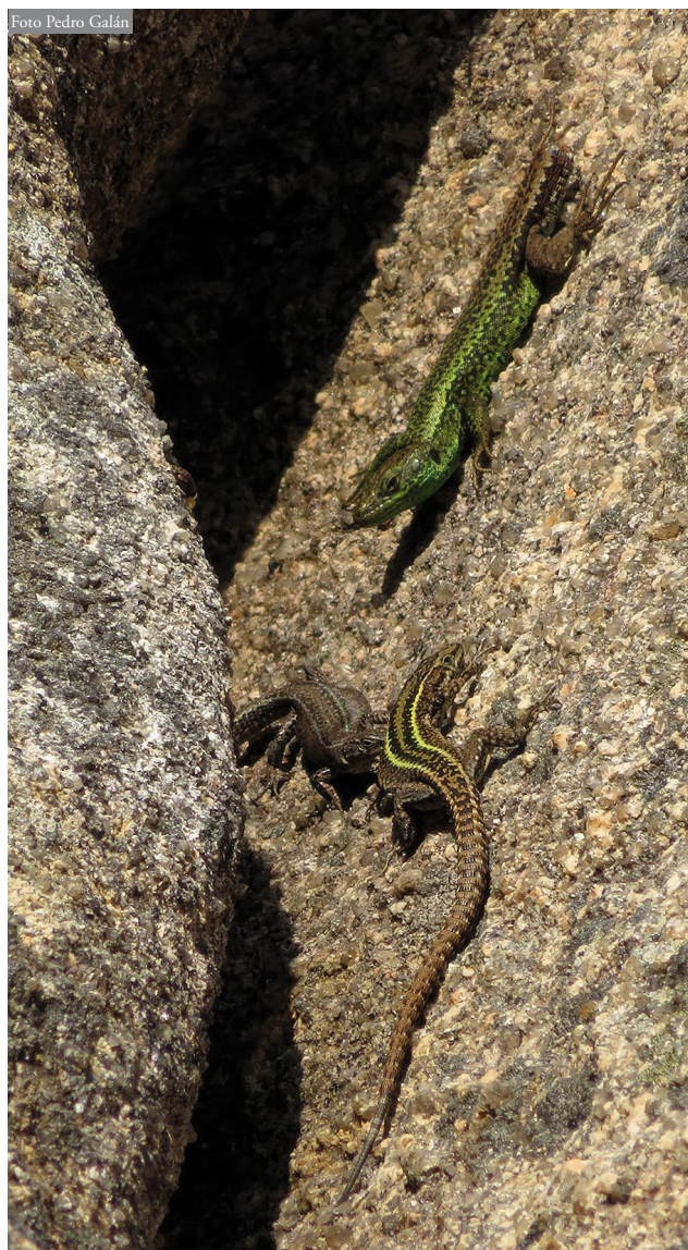
Figura 4: Iberolacerta monticola coexiste en sintopía con las otras dos especies de pequeños lacértidos del Monte Pindo, pudiendo verse con relativa frecuencia en estrecha proximidad. En la foto, arriba, un macho de I. monticola y, abajo, un macho de Podarcis bocagei (primer plano) y una hembra de Podarcis guadarramae (segundo plano). Alto das Cortes, Monte Pindo.

También su presencia en el Pindo se relaciona con la existencia de humedad al nivel del suelo, sobre todo en las altitudes medias, entre los 350 y los 550 msnm. Aunque gran parte del Monte Pindo es una formación rocosa carente de suelo vegetal, en los collados y vaguadas aparecen formaciones herbáceas y de matorral sobre suelos parcialmente higrótopos, donde se acumula el agua. Y, a menores altitudes, los amontonamientos de grandes bloques de roca en algunas vaguadas, mantienen corrientes de agua semisubterráneas, donde crece vegetación higrófila y se dan condiciones de elevada humedad y umbría en sus zonas inferiores (Galán et al. , 2007a). Al amparo de estos tipos de hábitat es donde I. monticola desciende hasta menores altitudes, en la orientación oeste (380 msnm) y en la norte (277 msnm).