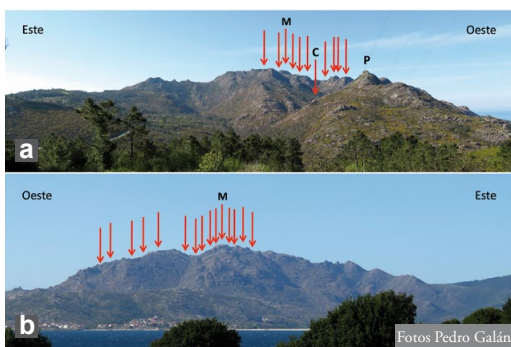
Figura 2: a) Vistas del Monte Pindo desde el norte (foto tomada desde las proximidades del mirador de Ézaro) y b) desde el sur (tomada desde Carnota). Las flechas indican las zonas aproximadas de observación de Iberolacerta monticola . Debido a los grandes desniveles del terreno, la mayor parte de los puntos de observación permanecen ocultos desde estas vistas lejanas. Con la letra “M” se señala A Moa, la cumbre más elevada (627 msnm), con la “P” el Pico Penafiel y con “C” la vaguada del Rego Caldeiras, donde I. monticola alcanza la menor altitud (277 msnm).

La vegetación, que crece en los espacios entre las rocas desnudas que predominan en superficie, está dominada por tojales y brezales de Ulex europaeus (= Ulex latebracteatus ), Pterospartum tridentatum (= Genista tridentata ), Halimium alyssoides (= Halimium lasianthum ), Calluna vulgaris , Cytisus scoparius y Erica cinerea (mayoritariamente de la clase Calluno vulgaris-Ulicetea minoris ), con manchas muy dispersas de roble enano ( Quercus lusitanica ). Este árbol, de porte muy reducido, es una singularidad florística de este mon-