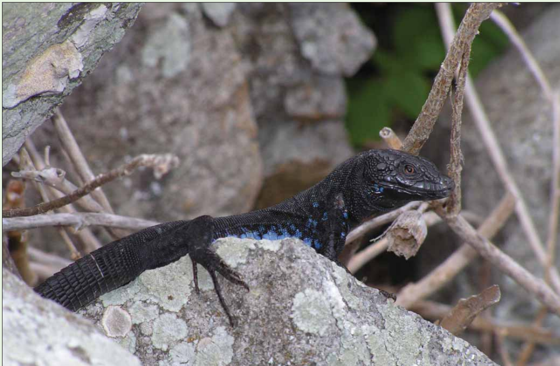
Slika 101. Brusnička gušterica/Brusnik wall lizard/ Podarcis melisellensis melisellensis .

Uzroci ugroženosti: Ova je podvrsta izdvojena za zasebnu procjenu zbog vrlo malenog i fragmentiranog otočnog areala te značajne prijetnje uzrokovane naseljavanjem invazivne primorske gušterice (DT 8.1). Dokumentirani eksperiment s hridi Pod Mrčaru (Vervust i sur., 2009) dokazuje da je ta opasnost vrlo realna. Pomorskim prometom u svrhu trgovine (posebice građevnim materijalom) i turizma omogućeno je ubrzano širenje primorske gušterice čak i na najmanje i nenaseljene hridi i otoke. Na mnoge od navedenih hridi i otoka lokalno je stanovništvo