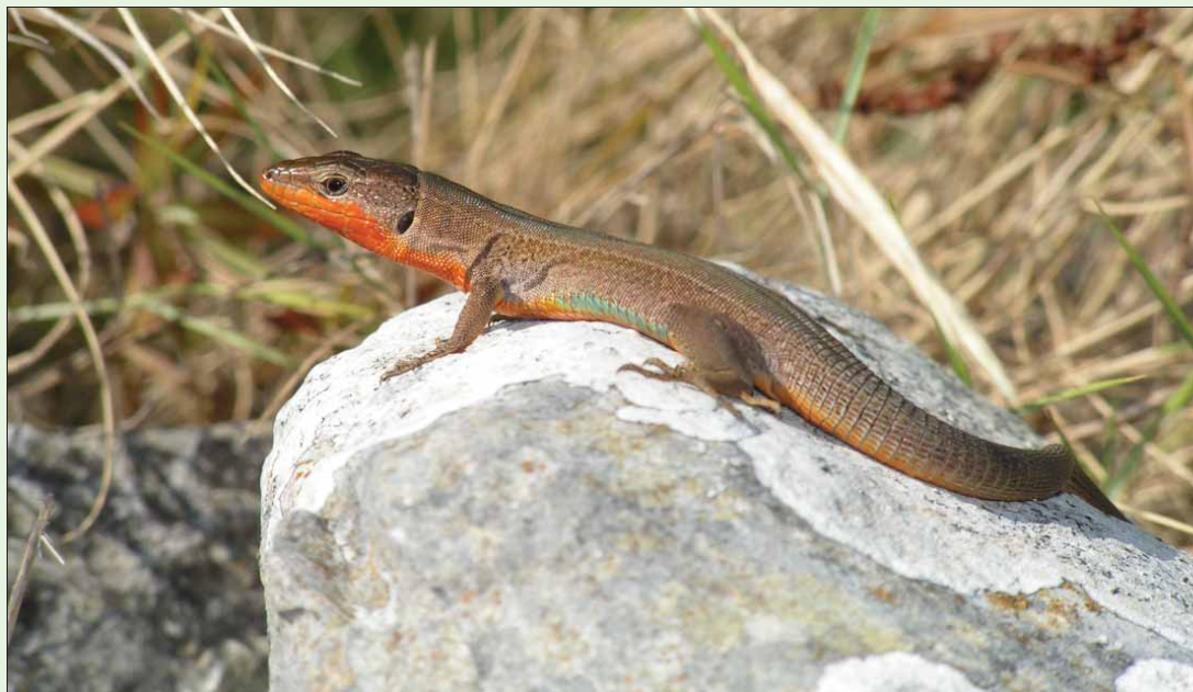
Slika 99. Mužjak krške gušterice/ Dalmatian wall lizard – male/ Podarcis melisellensis .

Taksonomska napomena: Do sada je na osnovi morfološke različitosti opisano 20 podvrsta, koje sve osim Podarcis melisellensis fiumanus isključivo žive na otocima, a znatno variraju u veličini i obojenosti. Njih čak 17 je ograničeno na samo jedan otok ili otočić (Breljih i Džukić, 1974). Međutim, već je Thorpe (1980) izrazio sumnju u toliki broj podvrsta te na osnovu analize 15 morfometrijskih značajki niza otočkih populacija razlikuje dvije osnovne grupe – sjevernu i južnu. Podnar i sur. (2004), na osnovu genetičkih istraživanja koja su uključila sve opisane podvrste, razlikuju 3 glavne skupine krške gušterice: P. m. fiumanus , P. m. melise-