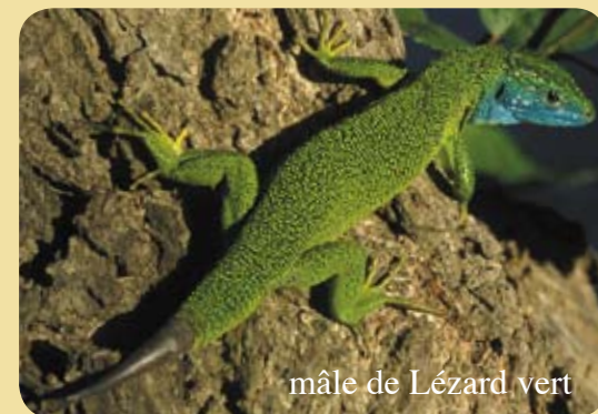
mâle de Lézard vert

Le Lézard vert peut-être confondu avec le Lézard ocellé, si l'animal est observé à distance ou dans de mauvaises conditions d'observation. Le lézard vert ne présente jamais d'ocelles bleus sur les flancs. Les adultes ont les écailles dorsales vertes et non jaunes et noires comme chez l'ocellé.