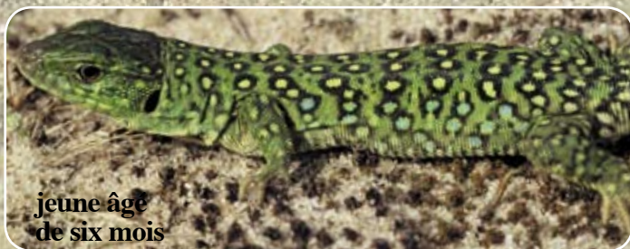
jeune âge de six mois