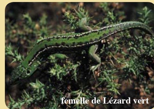
femelle de Lézard vert

Les mâles ont parfois la gorge bleue, ce que n'ont jamais les lézards ocellés.