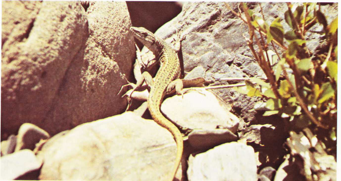
Podarcis hispanica , mâle, El Cotillo, Alcolea, Espagne.