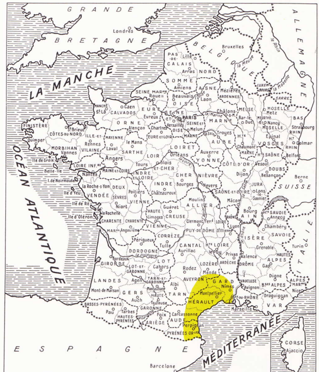
Carte 7. Podarcis hispanica .

Après l'accouplement, la ponte a lieu en mai et comporte seulement deux œufs d'assez grosse taille, puisque leur diamètre peut atteindre 12 mm. L'incubation dure 63 jours. Les jeunes mesurent environ 5 cm.