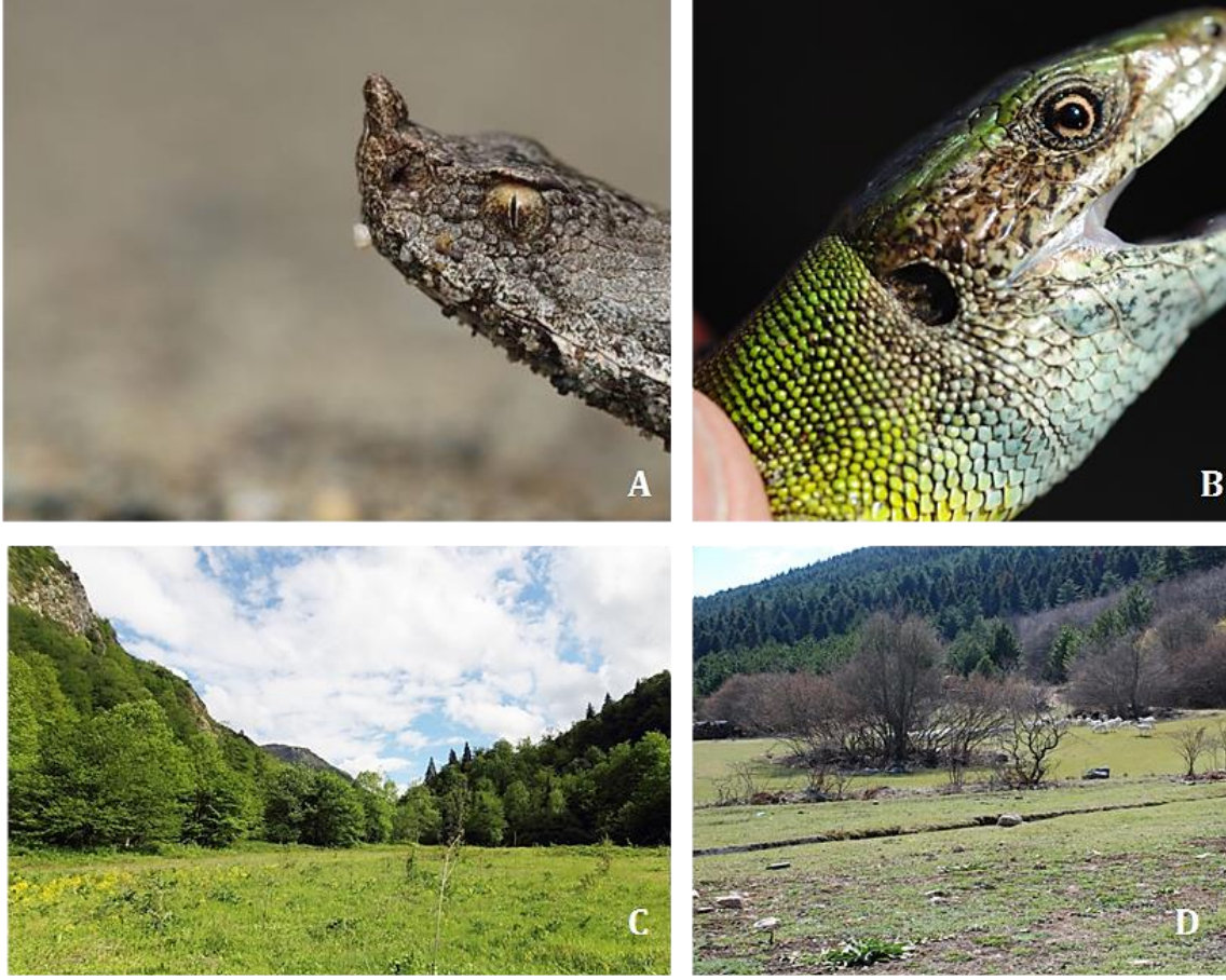
Şekil 1. A) Vipera transcaucasiana , B) Lacerta viridis , C) Yenice: V. transcaucasiana biyotopu, D) Küre: L. viridis habitati.