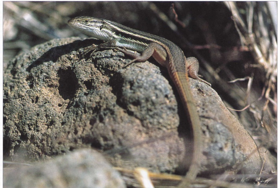
Algerischer Sandläufer ( Psammodromus algirus ) Foto: B. Trapp

[Quelle: Herpetologica 55 (1): 1 - 7 (1999) ]