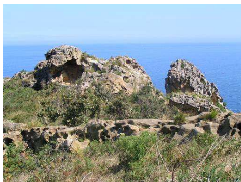
Autor: Iñaki Sanz-Azkue