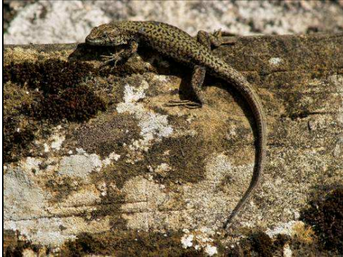
Autor: Miguel Lizana