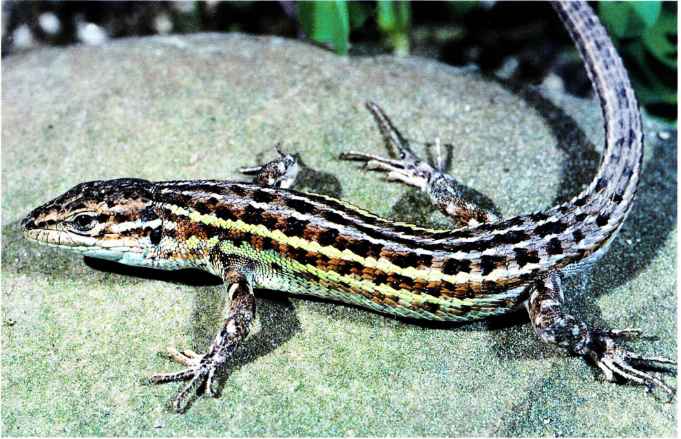
Lagartija cenicienta, macho en celo (Madrid).

tramos por manchas pardas o negruzcas de pequeño tamaño, lo que confiere al dorso un aspecto segmentado muy característico. Las partes ventrales suelen carecer de pigmentación oscura y presentan un fondo de tonalidades blancuzcas o amarillentas. En algunas poblaciones ibéricas, las escamas ventrales de las dos filas longitudinales más cercanas a los costados pueden presentar pequeñas manchas negras en toda la longitud del tronco.