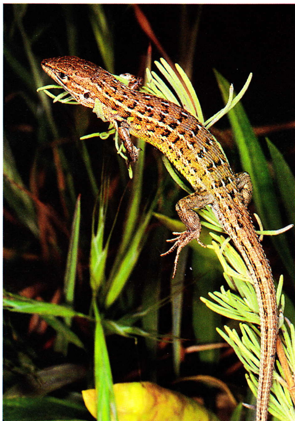
Lagartija cenicienta, macho (Madrid).

Barón y la Perdiguera, en el Mar Menor (Murcia), mantienen poblaciones de lagartija cenicienta.