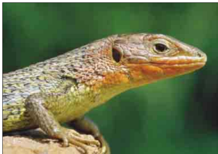
Ejemplar macho de Ferreira do Zezere, (Portugal)

Algunos autores sostienen que su expansión septentrional puede continuar incluso en la actualidad. Por el contrario, se ha constatado la extinción de la abundante pobla-