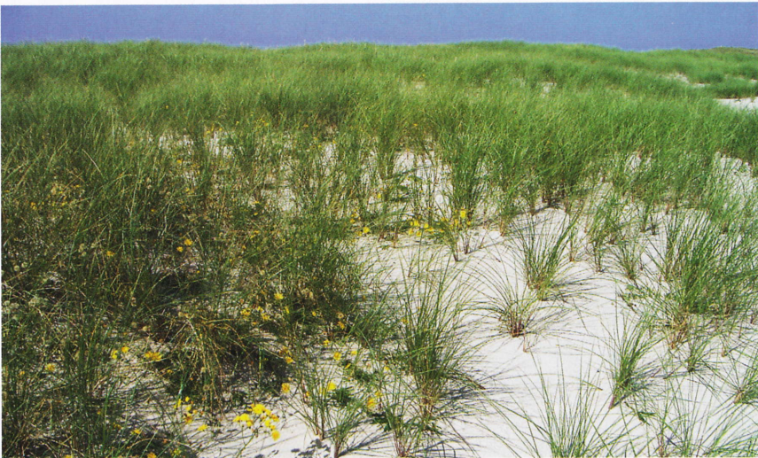
Abb. 2: Potenzielles Habitat der Zauneidechse in spärlich bewachsenen Weißdünen des NSG Hörnum-Odde im Umfeld eines aktuellen Fundortes.

NSG Hörnum-Odde: Sandstrand am Rand von Tetrapoden und Weißdünen (Abb. 2), 27.05.2012 [HU] (WINKLER & HUSSEL 2013)