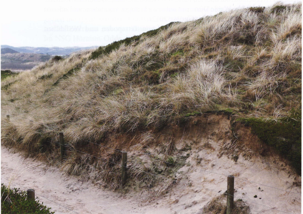
Abb. 3: Aktueller Fundort von zwei juvenilen Zauneidechsen an einem Wegsaum mit Strandhafer und offenem Sand nördlich von Hörnum.

Bei den aktuellen Kartierungen (Kap. 2.3), die sich auf die Grau- und Braundünenbereiche sowie die Geestheiden konzentrierten, gelangen keine Nachweise der Zauneidechse. Im Listland wurde die Art ehemals in Übergangsbereichen von Grau- zu Braundünen beobachtet. Nachweise gelangen dort an einer früheren Bunkeranlage [ST] und in einem Dünental bei der Jugendherberge [VÖ] (siehe Vegetationskarte von STRAKA & STRAKA 1984). Am erstgenannten Fundort existierte damals ein Vegetationsmosaik aus Sandmagerrasen und aufkommenden Beständen der Besenheide ( Calluna vulgaris ), wobei die Dünen durch die Bunkeranlage anthropogen überprägt waren (WALTHER STRIBERNY schriftl. Mitt.). In den Geestbereichen der Insel konnte die Art Anfang der 1980er Jahre bei Braderup an einem durch die Sandheide verlaufenden Weg, im NSG Morsum Kliff offenbar an der Steilküste beobachtet werden [VÖ].