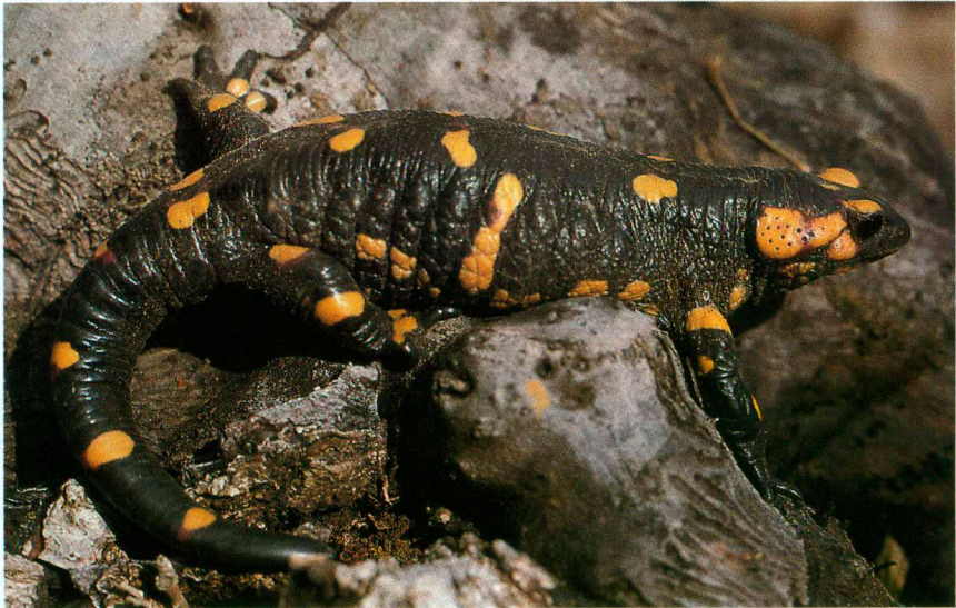
Abb. 5. Salamandra salamandra gallaica aus/from Freixo.

Auf die hohe Verbreitungsdichte und lokale Individuenmassierung dieser Art in NE-Portugal habe ich bereits hingewiesen (MALKMUS 1983). Präferenzräume zur Eiablage sind vornehmlich Stillwasserzonen in Bächen (Kolke, sehr langsam fließende Bereiche) und Brunnenschächte, selbst albercas (Fließwasserbrunnen), die als Waschstellen verwendet werden (z. B. bei Freixo). Bei Larinho fanden sich