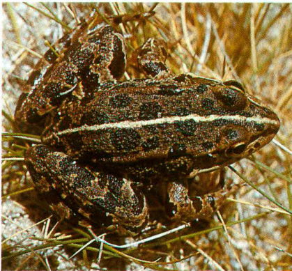
Abb. 6. Rana perezi aus/from Larinho.

Nach dem bisherigen Wissensstand (MALKMUS 1982, 1989) existieren in Portugal zwei, voneinander völlig isolierte Verbreitungsschwerpunkte. Inzwischen