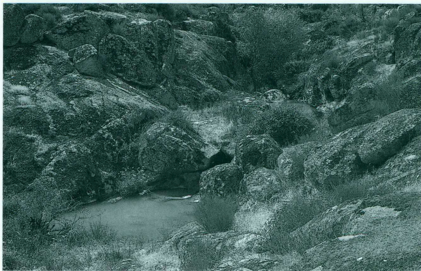
Abb. 2. Bach bei Larinho (Felsburgenlandschaft). / Brook near Larinho („area of castlelike granite blocks“). Habitat von/of Natrix maura , Triturus marmoratus , Alytes cisternasii , Rana perezi .