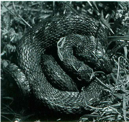
Abb. 8. Natrix maura vom Rio Douro in Ballstellung.

Ein adultes Exemplar durchschwamm den Rio Douro an einer circa 500 m breiten Stelle.