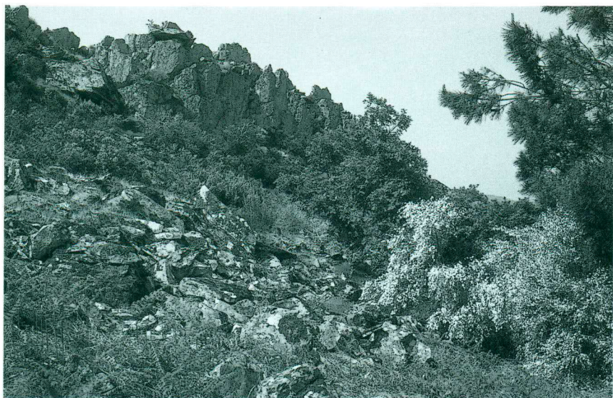
Abb. 4. Serra do Reboredo. Habitat von/of Lacerta lepida , Blanus cinereus , Chalcides bedriagai .

getation befindet sich nur noch relikthaft im Douro-Canyon in Form von Restwäldern, in denen Zürgelbaum ( Celtis australis ), Wacholder ( Juniperus oxycedrus ) und Steineiche ( Quercus ilex ) dominieren.