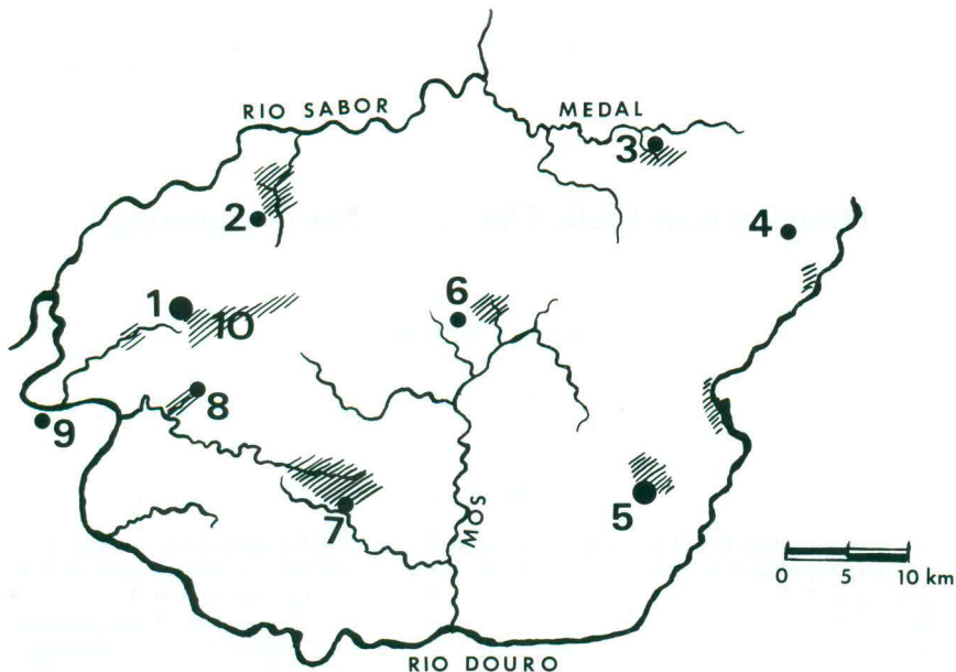
Abb. 1. Karte mit den Fundpunkten. Schraffiert: Untersuchungsgebiete. 1 = Torre de Moncorvo, 2 = Larinho, 3 = Quinta das Quebradas, 4 = Lagoaca, 5 = Freixo, 6 = Mós, 7 = Ligares, 8 = Acoreira, 9 = Pocinho, 10 = Serra do Reboredo.

Map with localities. Hatched: Study areas.