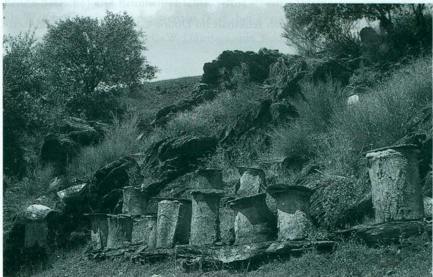
Abb. 3. Schieferbruchstücke bei Mós, mit Bienenstöcken. Habitat von Podarcis hispanica und Tarentola mauritanica .

Fragments of argillaceous slate near Mós, with beehives. Habitat of Podarcis hispanica and Tarentola mauritanica .