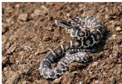
21. Gloydius halys (Pallas, 1776).