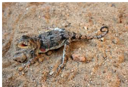
5. Phrynocephalus versicolor Strauch, 1876.