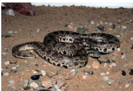
15. Eryx tataricus (Lichtenstein, 1823).