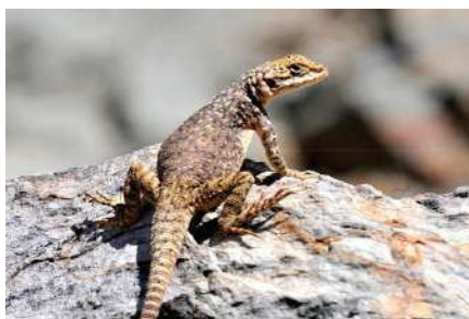
4. Paralau dakia stoliczkana altaica (Munkhbayar et Shagdarsuren, 1970)