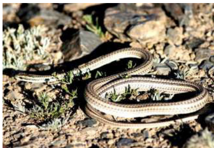
20. Psammophis lineolatus Brandt, 1838.