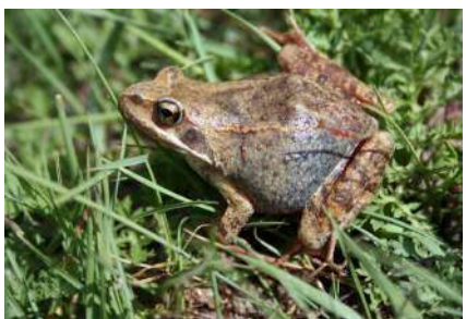
6. Rana chensinensis David, 1875.