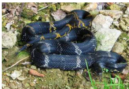
18. Elaphe schrenskii (Strauch, 1873).