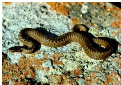
22. Pelias berus (Linnaeus, 1758).