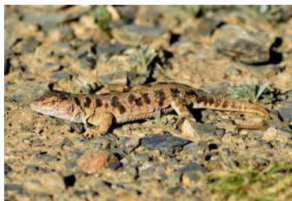
8. Eremias arguta Pallas, 1773.