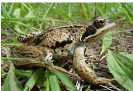
5. Rana amurensis Boulenger, 1886.