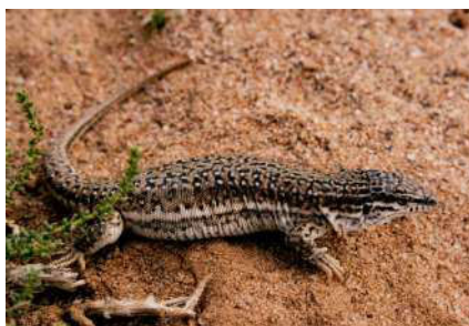
10. Eremias multiocellata Gunther, 1872.