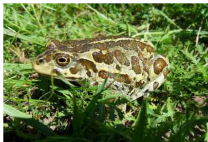
3. Strauchbufo raddei (Strauch, 1876).