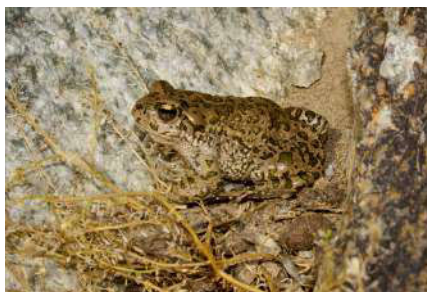
2. Bufotes pewzowi (Bedriaga, 1898)