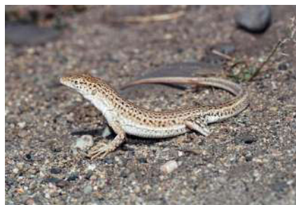
12. Eremias vermiculata Blanford, 1875.