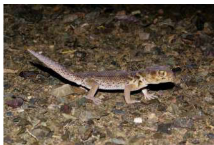
3. Teratoscincus przewalskii Strauch, 1887.