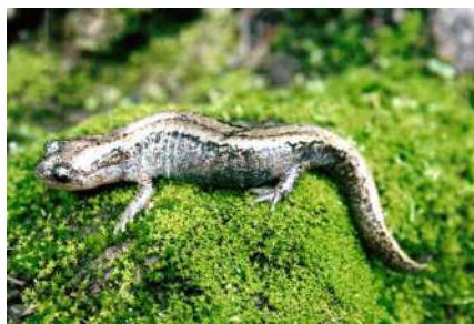
1. Salamandrella keyserlingii Dybowski, 1870