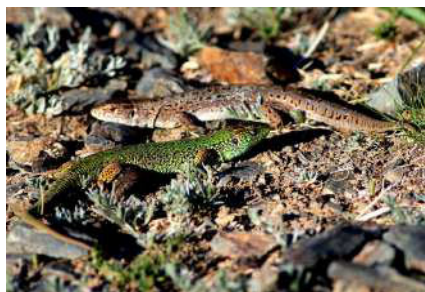
13. Lacerta agilis Linnaeus, 1758.