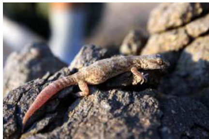
1. Alsophylax pipiens (Pallas, 1814).