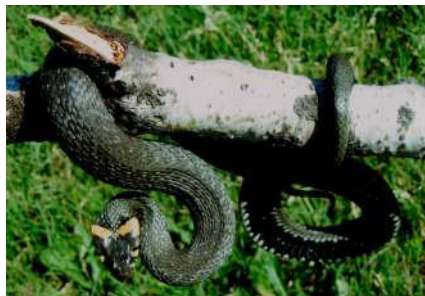
19. Natrix natrix (Linnaeus, 1758).