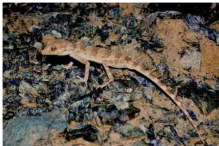
2. Cyrtopodion elongatus (Blanford, 1875).