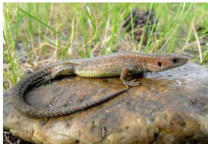
14. Zootoca vivipara Jacquin, 1787.