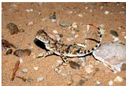
6. Phrynocephalus helioscopus (Pallas, 1771).