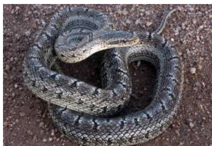
17. Elaphe dione (Pallas, 1773).