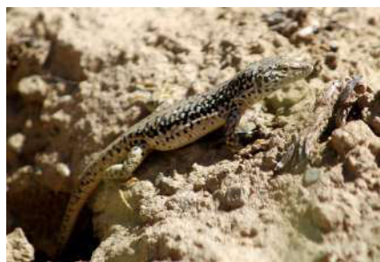
9. Eremias dzungarica ORLOVA et al., 2017