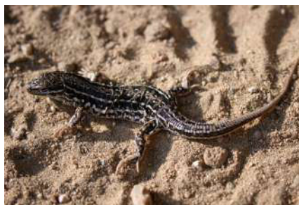
7. Eremias argus Peters, 1869.