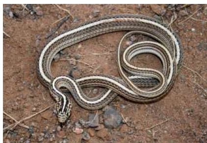
16. Coluber spinalis (Peters, 1866).