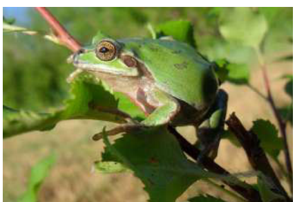
4. Dryophytes japonicus (Guenther, 1859).