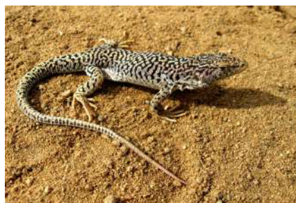
11. Eremias przewalskii Strauch, 1876.