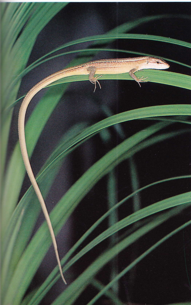
◀ Langschwanzzeidechsen (Gattung Takydromus ) klettern hervorragend. Der Schwanz hilft ihnen vermutlich, das Körpergewicht zu verteilen, wenn sie über das Gras hinwegflitzen.

Die geschlechtsreifen Männchen erkennt man an den Hemipenesschwellungen unter der Schwanzwurzel. Sie werden besser getrennt gehalten. Die Nachkommen werden in einem schlichten, leicht feuchten Terrarium aufgezogen, das ähnlich beleuchtet wird wie das der adulten Tiere.